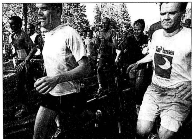
Idyll. En løpetur rundt Sognsvann gir svette på pannen, men er balsam for sjelen. Og kondisen.