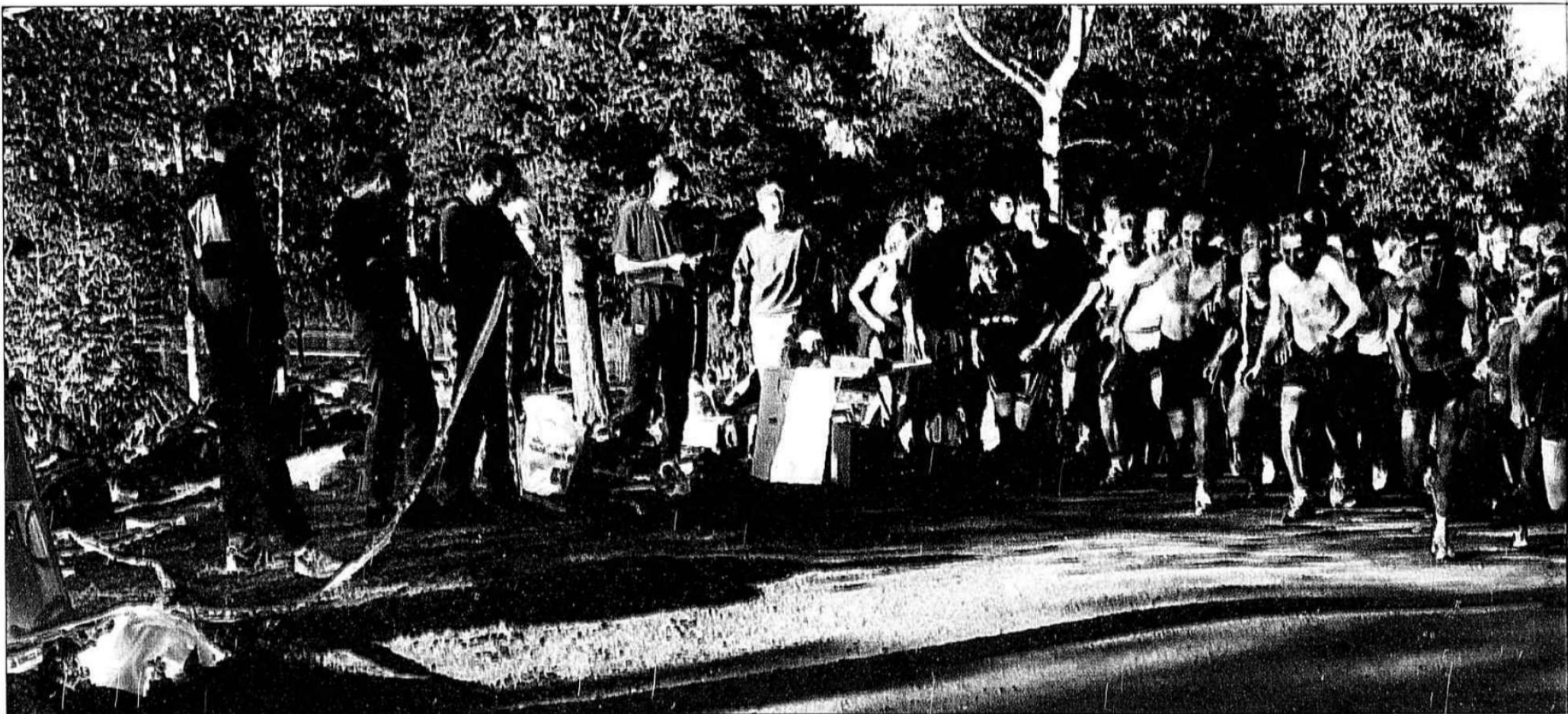
Høstlepp. Kjønn, alder eller fart spiller ingen rolle når trimglade samles ved Sognsvann hver onsdag.

Mario Zagallos, tidligere brasiliansk landslagstrener, hjerteproblemer er ikke så alvorlige som først antatt. 70-åringen fikk urolig hjerterytme under en tennisøkt tirsdag. Han vil trolig bli utskrevet fra sykehus onsdag. Zagallo vant VM som spiller i 1958 og 1962. Han trente Brasil til VM-gull i 1970 og var assistent i 1994. (NTB)